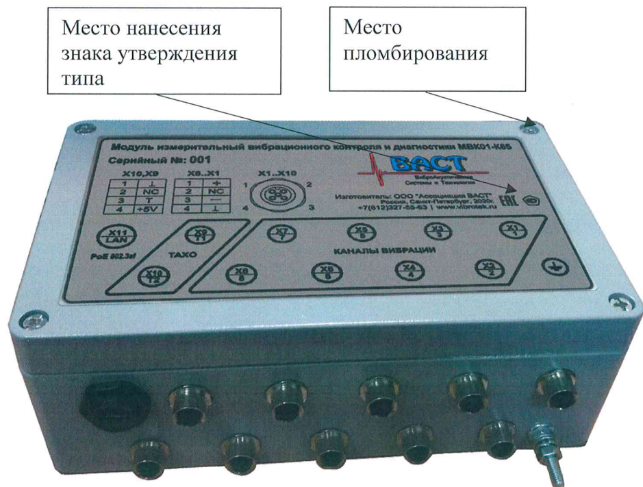
Рисунок 3 - Общий вид, место нанесения знака утверждения типа и место пломбирования от несанкционированного доступа модулей измерительных вибрационного контроля и диагностики MBK01-K65