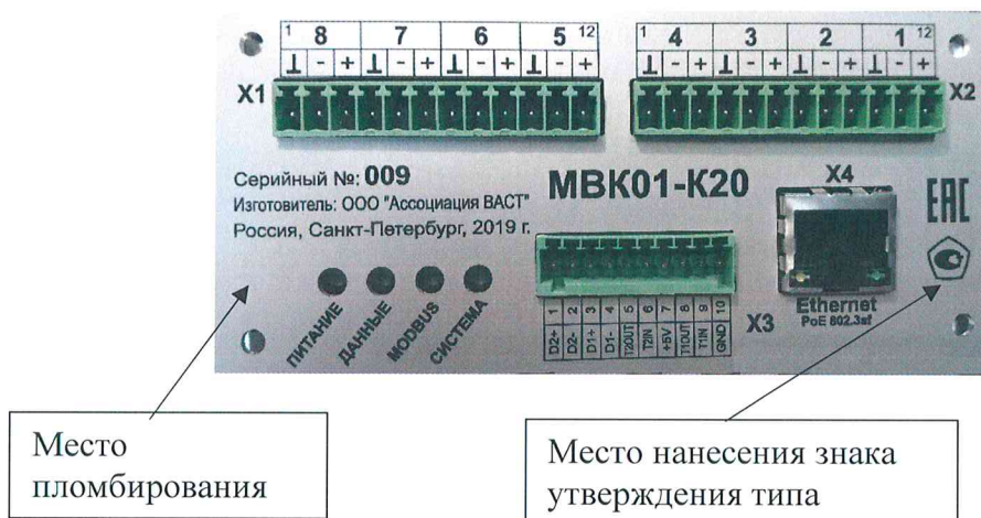
Рисунок 1 - Общий вид, место нанесения знака утверждения типа и место пломбирования от несанкционированного доступа модулей измерительных вибрационного контроля и диагностики МВК01-K20